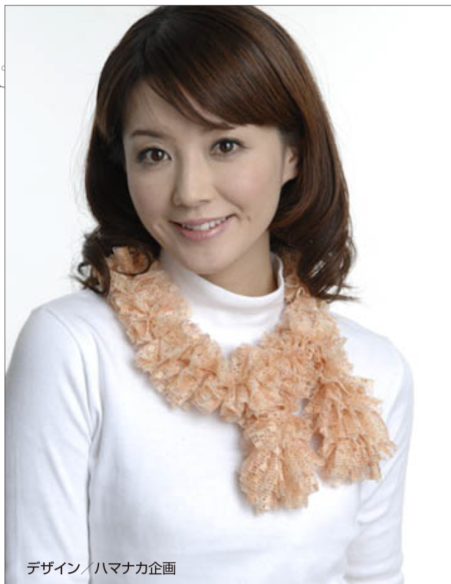
デザイン/ハマナカ企画