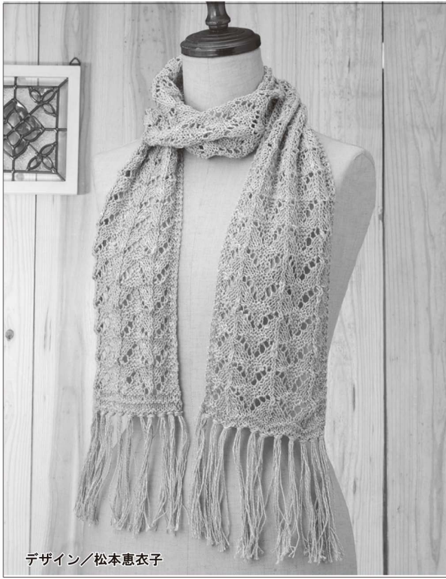
デザイン/松本恵衣子