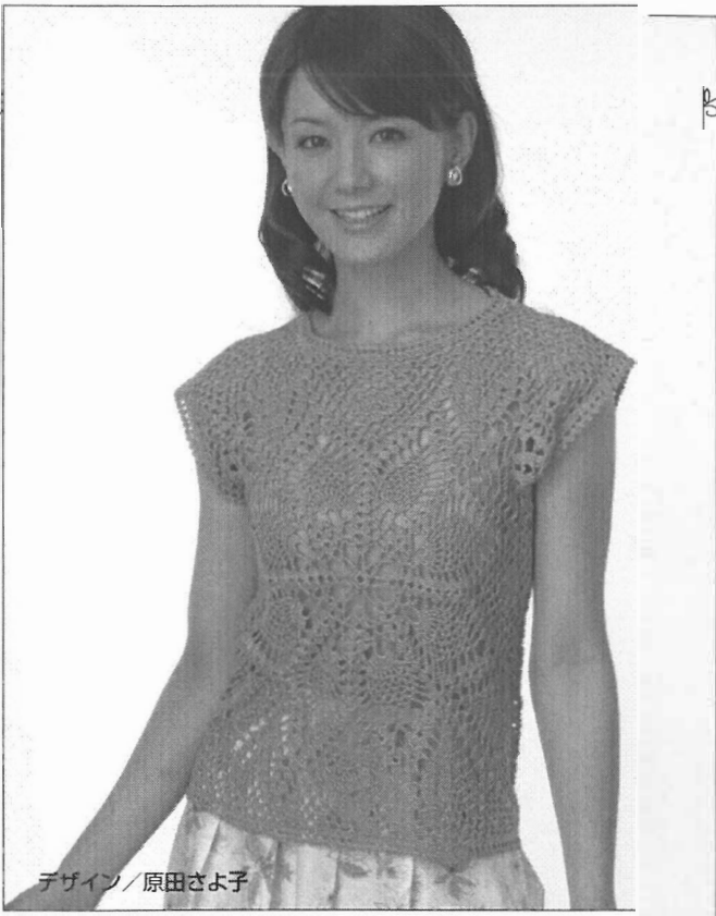
デザイン/原田さよ子