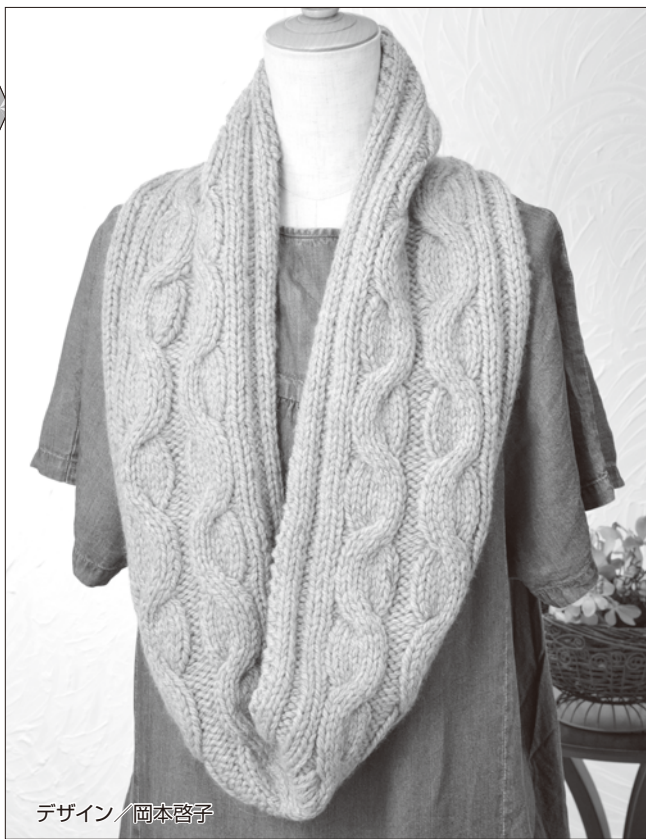
デザイン/岡本啓子

◆使用糸 ソノモノ《超極太》(40g玉巻) グレーベージュ(No.12)5.5玉(220g)