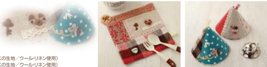
左: ポットマット(ベースの生地/ウール・リネン使用) 右: なべつかみ(ベースの生地/ウール・リネン使用)