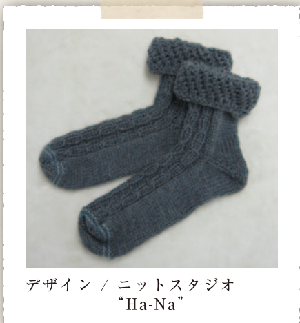
デザイン / ニットスタジオ "Ha-Na"