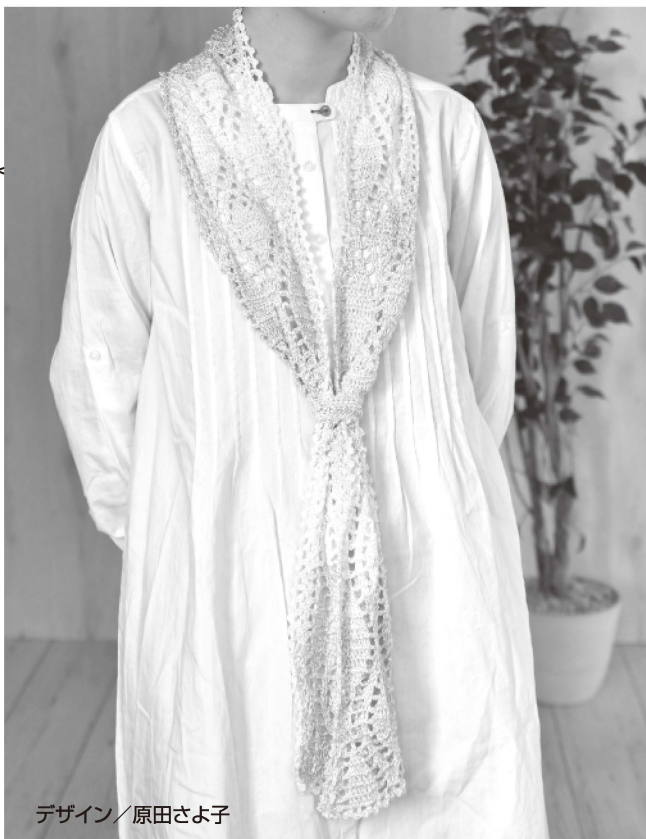
デザイン/原田さよ子