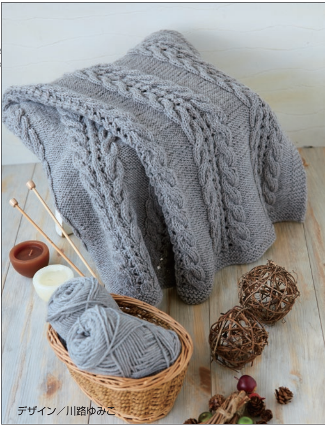
デザイン/川路ゆみこ