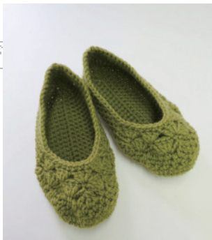
デザイン／深瀬 智美