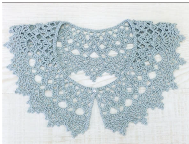
デザイン/ハマナカ企画

◆使用糸 フラックスC《ラメ》(25g玉巻) ブルー(No.506)1玉(25g)