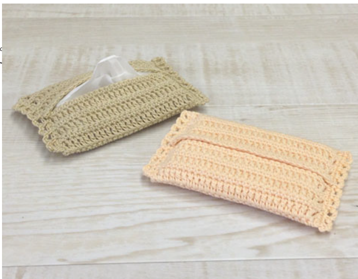
デザイン/ハマナカ企画