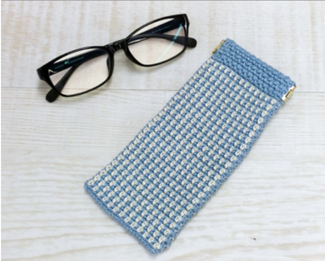
デザイン/ハmanaカ企画