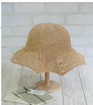
デザイン/深瀬智美