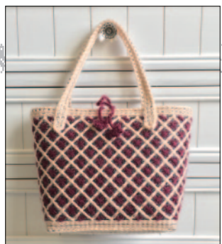
デザイン/城戸珠美