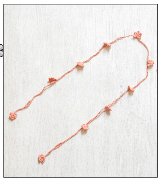
デザイン/ハマナカ企画