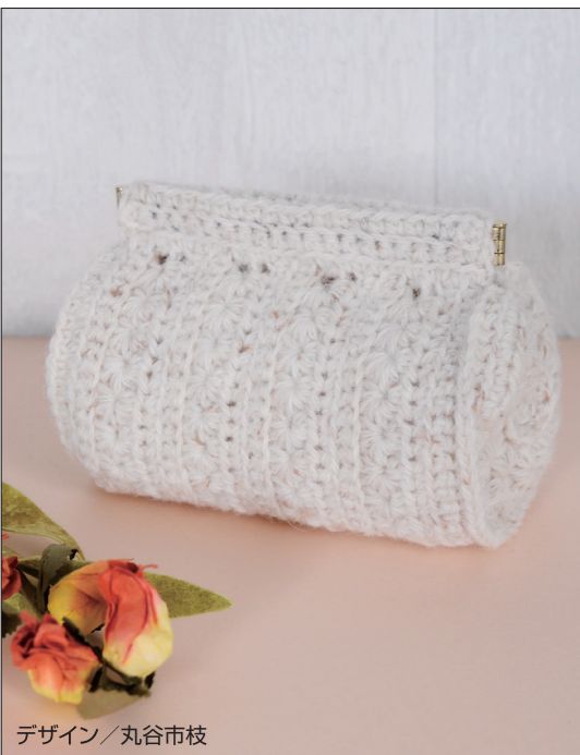
デザイン/丸谷市枝

◆編み方 糸は1本どりで編みます。 【本体】共糸鎖の作り目で編み始め、模様編みで編みます。本体から目を拾い、通し口を縁編みで編みます。【側面】わの作り目で編み始め、モチーフを2枚編みます。【仕上げ】本体と側面を細編みで編みつなぎます。通し口を折り線で折り、頭目手前側半目を拾って本体裏側に巻きかかります。バネ口金を通します。