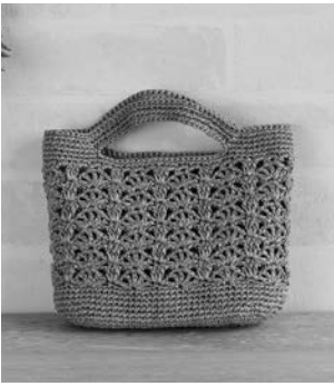
デザイン/城戸珠美