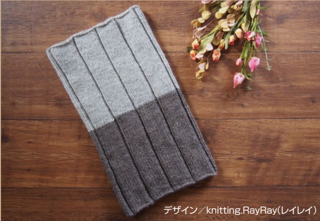
デザイン／knitting.RayRay(レイレイ)