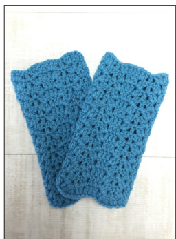
デザイン/ハmanaカ企画