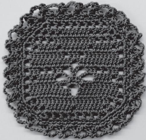
デザイン / chi-sa-ko