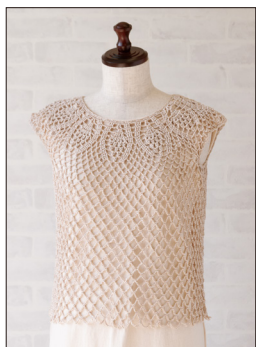
デザイン/原田さよ子