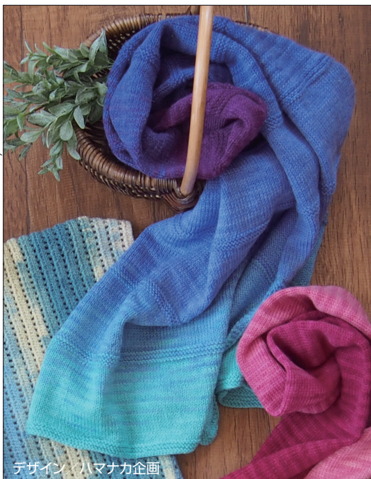
デザイン ハマナカ企画

(例) 45(100目) = 45cm(100目) 38(60段) = 38cm(60段)