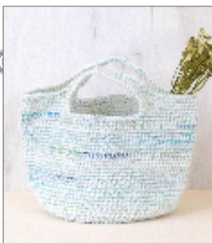
デザイン/城戸珠美