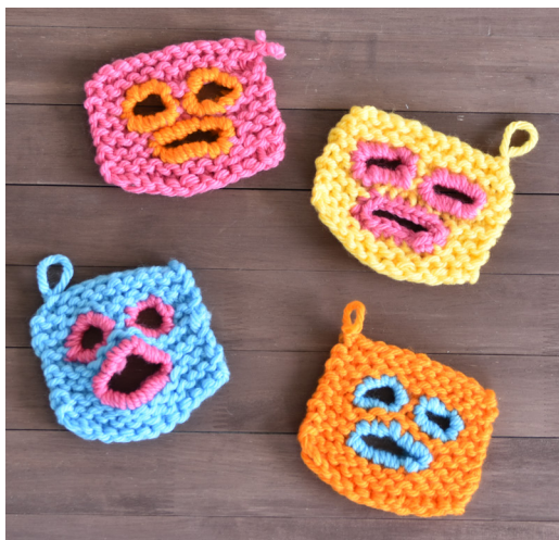
デザイン ガーナ (佐藤良祐)