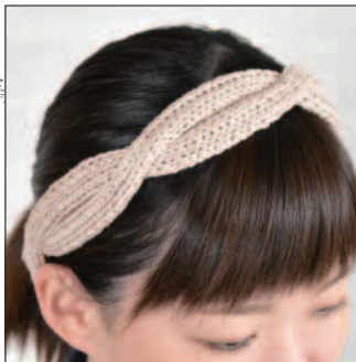
デザイン/すぎやまと