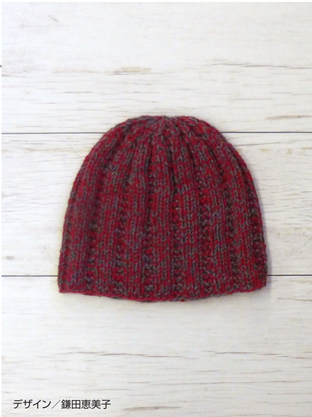
デザイン/鎌田恵美子