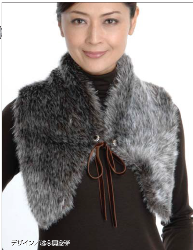
デザイン/松本恵衣子