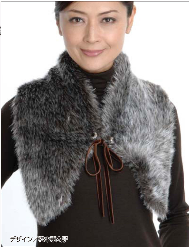
デザイン/松本恵衣子