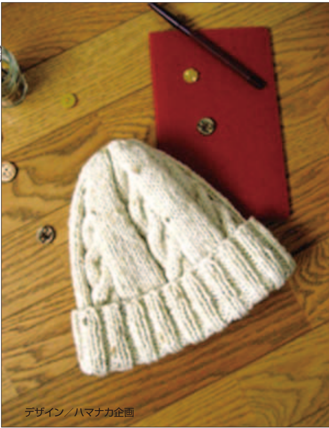
デザイン/ハマナカ企画