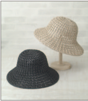
デザイン/家郷輝子

☆でき上がり寸法 頭まわり 約58cm。 ☆使用糸 エコアンダリヤ(40g玉巻)